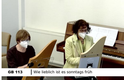
GB 113 | Wie lieblich ist es sonntags früh