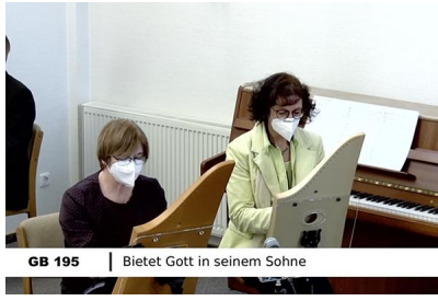
GB 195 | Bietet Gott in seinem Sohne