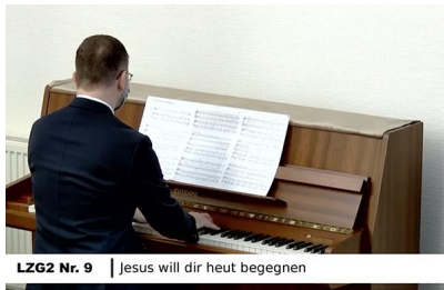
LZG2 Nr. 9 | Jesus will dir heut begegnen