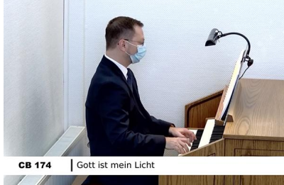
CB 174 | Gott ist mein Licht