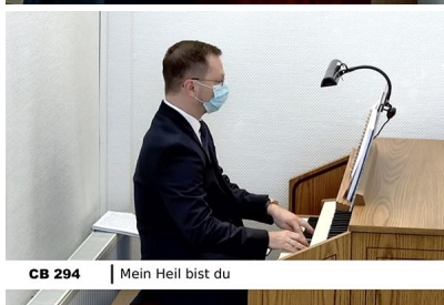
CB 294 | Mein Heil bist du