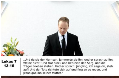
Lukas 7 13-15 „Und da sie der Herr sah, jammerte sie ihn, und er sprach zu ihr: Weine nicht! Und trat hinzu und berührte den Sarg, und die Träger blieben stehen. Und er sprach: Jüngling, ich sage dir, steh auf! Und der Tote richtete sich auf und fing an zu reden, und Jesus gab ihm seiner Mutter.“