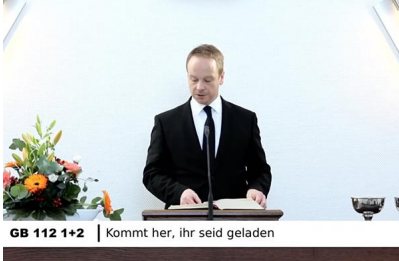
GB 112 1+2 | Kommt her, ihr seid geladen