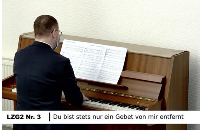
LZG2 Nr. 3 | Du bist stets nur ein Gebet von mir entfernt